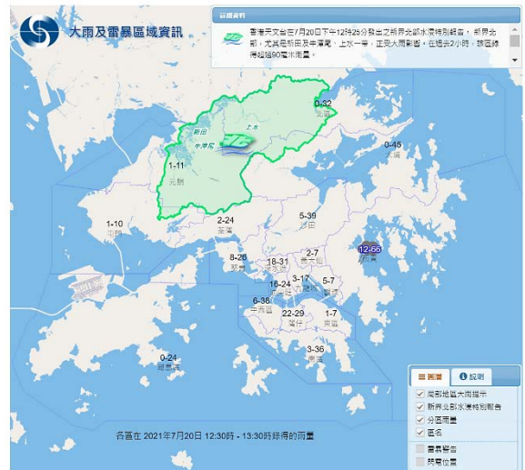
「大雨及雷暴區域資訊」網頁

天文台自行研發的「小渦旋」臨近預報系統，利用雷達、衛星、雨量及閃電等數據，並結合電腦模式模擬結果，預測未來六小時暴雨及相關連的惡劣天氣。除支援天氣預測和警報外，「小渦旋」亦透過天文台網站和「我的天文台」流動應用程式向公眾提供未來兩小時降雨和一小時閃電臨近預報。天文台獲世界氣象組織指定為亞洲區的臨近預報區域專業氣象中心，為區內氣象機構提供有關高影響天氣事件的臨近預報產品與技術。