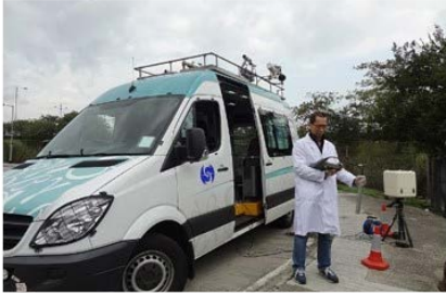
天文台人員進行輻射巡測

天文台負責監測香港境內的環境輻射水平，並採集空氣、土壤、水及食品樣本作輻射測量。天文台的輻射測量服務獲得 ISO 9001:2015 質量管理體系認證。萬一廣東省內的核電站發生核事故，天文台會即時加強輻射監測工作、評估輻射後果及向政府提供有關採取適當防護措施的技術意見。