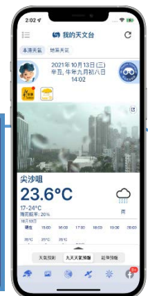
天文台「氣象冷知識」節目（左）及全新介面的「我的天文台」流動應用程式（右）