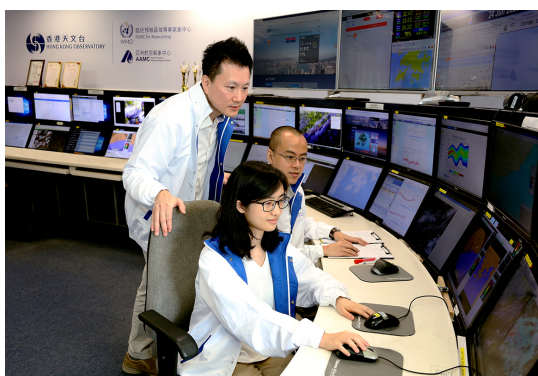
天文台人員二十四小時不斷提供氣象服務

天文台為公眾、漁民、航海人士、航空界和其他特殊用戶提供天氣服務。透過特別安排，天文台也為大型活動如煙花匯演和體育盛事等提供適切的氣象服務。天文台的天氣預測及警告服務已取得國際標準化組織ISO 9001:2015質量管理體系認證。