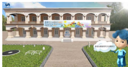
「香港天文台開放日 2021」網頁

為了加強市民對氣候變化、災害天氣、輻射監測和天文台各方面服務的認識，天文台定期舉辦公眾講座、研討會、課程、工作坊和展覽，包括天文台開放日，亦提供天文台總部及外站設施的 360 度虛擬導覽、天氣觀測網上短片課程和電子書，以進一步推廣公眾教育。天文台也製作各種宣傳和公眾教育材料、天文台網誌及天氣隨筆，亦與其他政府部門攜手合作推行「科學為民」活動，讓市民多了解公共服務背後所採用的科技。